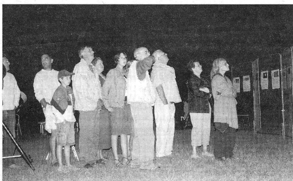
Chaque année en France et depuis 1991, les Nuits des étoiles font déplacer des milliers de curieux dans la campagne, loin de la ville et de ses lumières.

> Marigny. Les Têtes en l'air , pour la quatrième année, vous donnent rendez-vous au